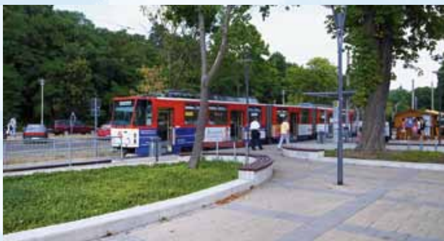
Endstation gegenüber dem Bahnhof an der Ostbahn: Hierher lautet die Zielbeschilderung „Strausberg S-Bahn“