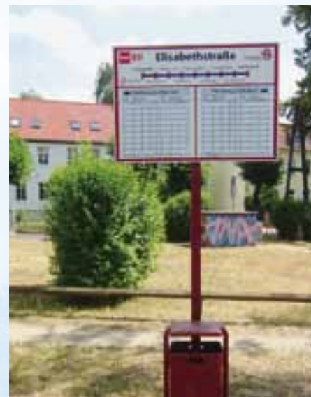
Ungewöhnlich der weithin sichtbare Fahrplan an den Haltestellen.