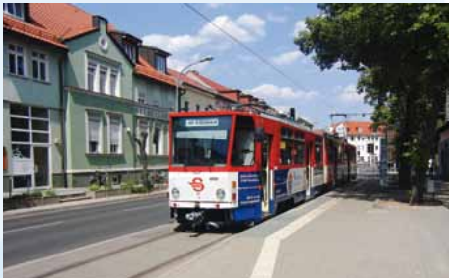
Endstation „Lustgarten“: In Seitenlage neben der Straße legt die Bahn die Hälfte des Weges zurück. Nach links gelangt man zur Fähre.