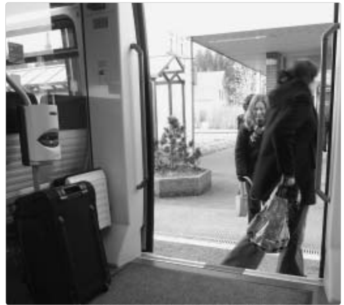
Aussteigen, um den Fahrschein zu entwerten? In diesem Zug wäre der Vorfall von Hude unmöglich. Immer mehr Aufgabenträger verlangen Automaten und Entwerter im Zug.

➤ der Fahrgast 3/2007 berichtete: „Deutsche Bahn im Verfolgungswahn“, „Kundenverfolger statt Kundenbetreuer“ und „Fahrgastjäger auf Provisionsbasis“. Ausgangspunkt zunehmender Beschwerden war die Einstellung des Fahrscheinverkaufs durch DB Regio in Bayern, aber auch der Einsatz von Sicherheitsdiensten zur Fahrscheinkontrolle bei der Berliner U- und Straßenbahn. Was der Fahrgast damals beschrieben hatte, beschäftigte die breite Öffentlichkeit ein Jahr später – als Kinder betroffen waren. Am 21. Dezember 2008 bezog PRO BAHN mit einer Pressemitteilung Stellung: „DB-Führung ist für fahrgastfeindliches Verhalten von Zugbegleitern verantwortlich.“