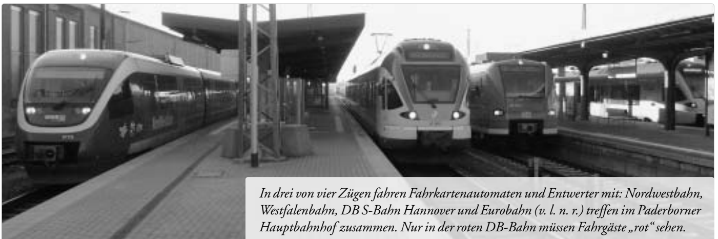
In drei von vier Zügen fahren Fahrkartenautomaten und Entwerter mit: Nordwestbahn, Westfalenbahn, DB S-Bahn Hannover und Eurobahn (v. l. n. r.) treffen im Paderborner Hauptbahnhof zusammen. Nur in der roten DB-Bahn müssen Fahrgäste „rot“ sehen.

Die DB möchte gern antworten: „Nie ohne Fahrschein einsteigen!“ Aber das funktioniert nicht mehr – die DB ist nicht mehr allein auf der Schiene unterwegs. Diese Botschaft müsste eigentlich irgendwann bei der DB-Führung ankommen.