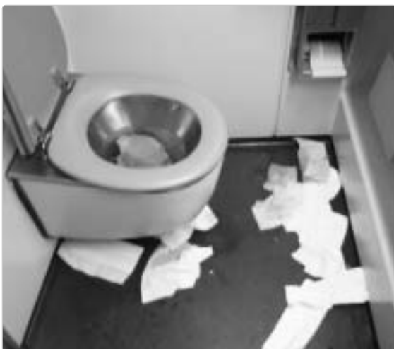
Dieses Foto hätte auf Seite 30 der Ausgabe 4/2008 gezeigt werden sollen. Die Redaktion bittet für den technischen Fehler um Entschuldigung.