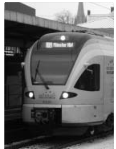
Zwei Toiletten auf 217 Sitzplätze: der vierteilige Triebwagen „Flirt“ im Hellweg-Netz.