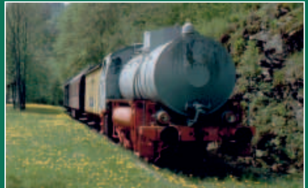
Im Bahnhof Lichtenberg steht ein Zug. Aber es ist ein historisches AusstellungsstŸck, das keinen Meter vor oder zurŸck fahren kann.