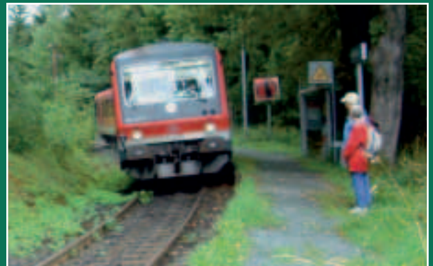
Haltepunkt Hsllental: Zwei Wanderer haben ihn tatsŸchlich gefunden!