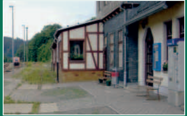
Bahnhof Blankenstein: der Blick nach SŸden in Richtung Hsllental.