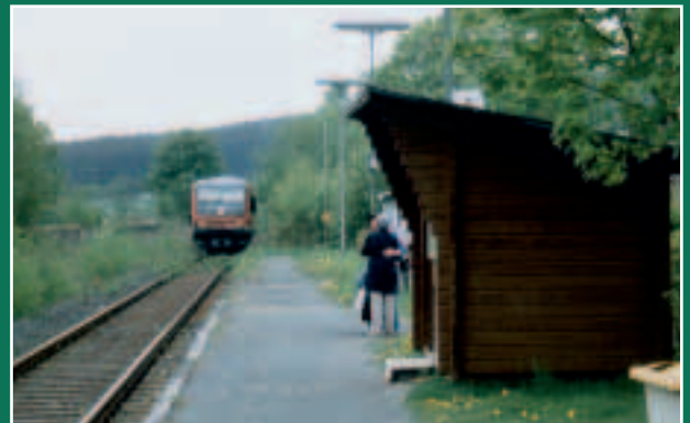
MarxgrŸn: Ganz weit weg von Berlin und MŸnchen ist Regionalisierung noch nicht angekommen.