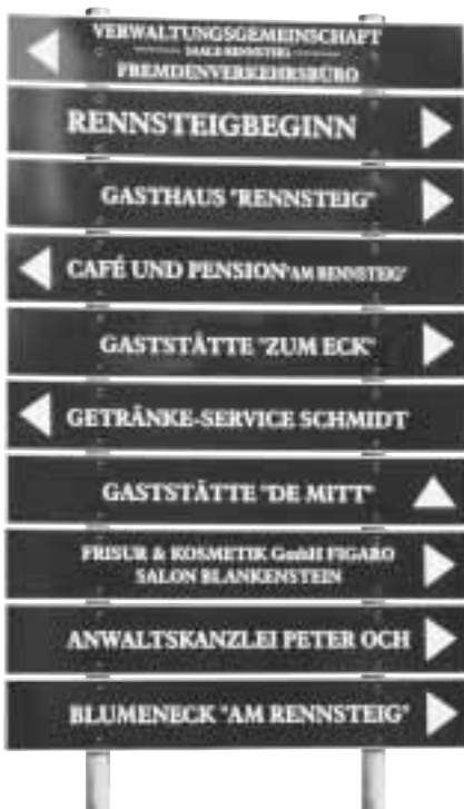
Freundlicher Empfang: Wegweiser gegenüber dem Bahnhof Blankenstein, Thüringen. Mehr dazu ab Seite 46.

Viele städtische Verkehrsverbünde haben es sich zur Regel gemacht, auf Bahnsteigen und Haltestellen Übersichts- und Umgebungspläne auszuhängen, auf denen sich der Ortsunkundige informieren kann. Einige Aufgabenträger haben die wichtigsten Informationen auch schon für Bahnhöfe zur Verfügung gestellt. Einige Unternehmen, die nicht DB heißen, zeigen auch in der Region, dass Information möglich ist. Hier und dort haben PRO BAHN-Regionalverbände Abhilfe geschaffen. Warum gibt es ein Minimum an Informationen aber noch nicht als Standard auf Bahnstationen? Die Stationsgebühren sind hoch genug. Der Aufwand ist hingegen gering.