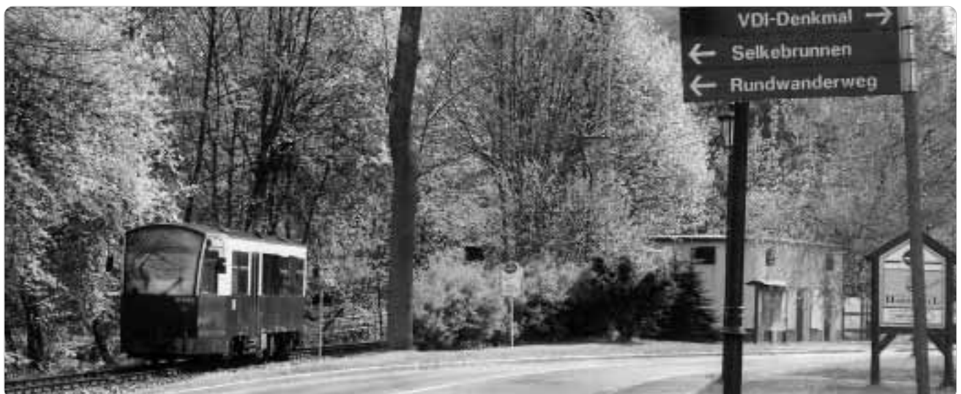
Brauchen Bahntouristen Rundwanderwege? Die Selketalbahn bringt Wanderer morgens hin und abends zurück.

Am Bahnübergang können wir die Straße verlassen. Wir müssen den Waldweg neben der Strecke und in der Nähe der Selke finden; er versteckt sich. Genauso verstecken sich in Silberhütte die Gebäude, in denen Feuerwerkskörper und Munition hergestellt werden. Wer in Harzgerode übernachtet, kann den Silberhütter Fußweg gehen, uns bleibt bis Alexisbad die recht belebte Straße, kein Weg an der Selke entlang. Da ist uns der Bus lieber. Der fährt nicht, wie wir nach langem Warten bemerken. Wegen Straßenbauarbeiten wurde die Linie umgeleitet, was ein Aushang an der Haltestelle bekannt