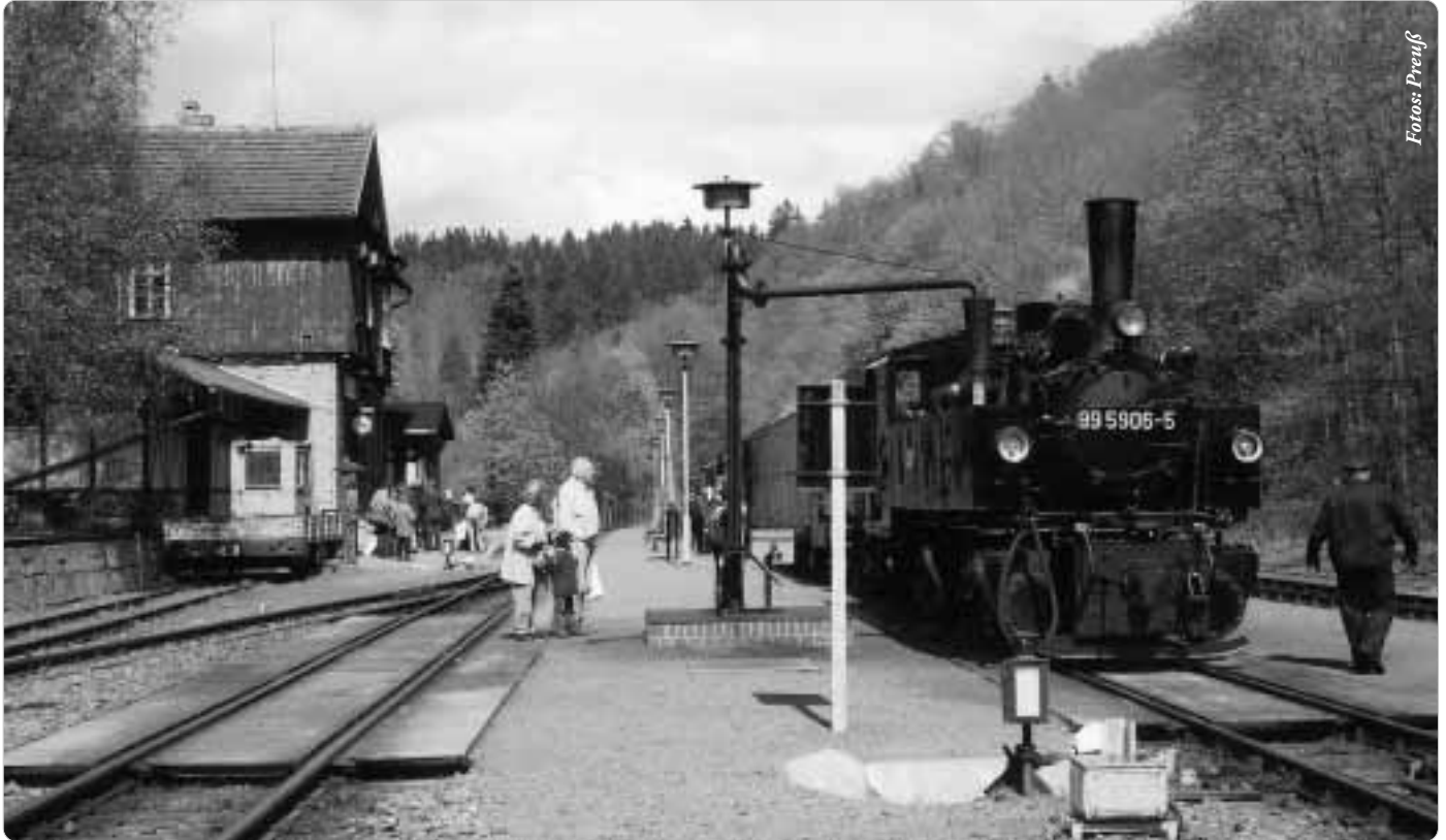
Dampfzug in Alexisbad: Künftig fahren sie täglich von Quedlinburg nach Hasselfelde und Harzgerode. Freitags und samstags ist ein dritter Dampfzug im Einsatz.

Neue Schmalspurstrecke ab Quedlinburg eröffnet – warum aber im kalten Winter? Von Erich Preuß