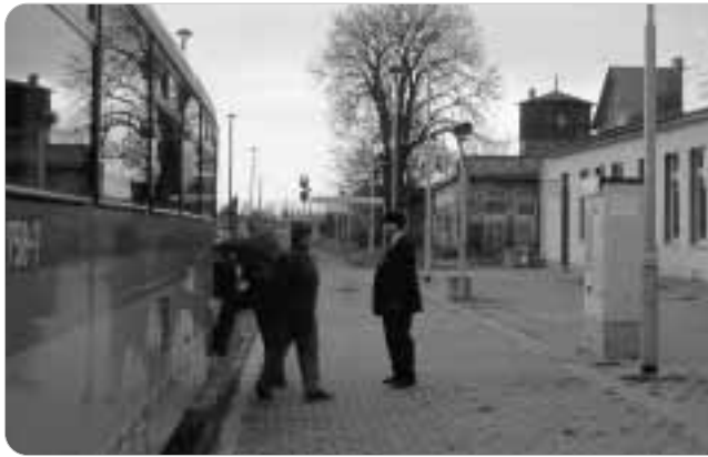
Barbarossa schläft, der Messzug nicht. Die Deutsche Bahn AG statuiert wieder einmal ein Exempel: Zugkreuzung in Bad Frankenhausen.

schaftlichkeit nicht ausreichend dargelegt. Mittlerweile hat die DB Widerspruch eingelegt, sodass das Verfahren in der Schwebe ist.