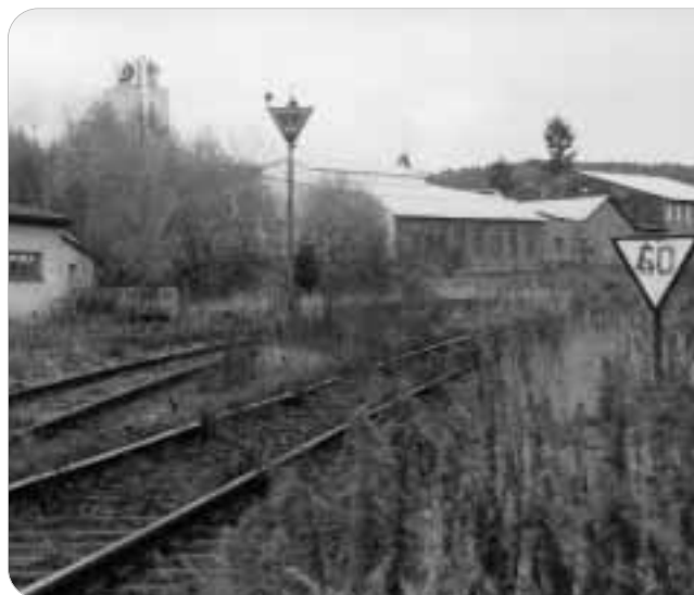
Solche Bahnlinien sind keine Empfehlung für die Ansiedlung von Industriebetrieben.

Doch die Rechte beschränken sich darauf, den Zugang diskriminierungsfrei zu erhalten. Ein Recht auf Ausbau und Schaffung neuer Kapazitäten ist damit nicht verbunden, genauso wenig wie ein Recht darauf, dass die vereinbarten Trassenpreise zweckentsprechend in diese Strecke investiert werden.