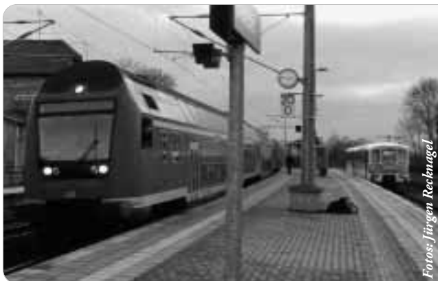
Abfahrt nach Sondershausen in Bretleben: Diese „Ferkeltaxe“ aus der Reichsbahnzeit brauchte nur 55 Minuten. Jetzt fahren neue Triebwagen und die Fahrzeit beträgt fortschrittliche 80 Minuten.

Der Kyffhäuserkreis kämpft um den Erhalt der Strecke, denn die Kreisstadt Bad Frankenhausen würde ihren Bahnanschluss sonst ganz verlieren. Mit großem Geld kann der Kreis jedoch nicht winken. Zwar gibt es Unternehmen, die sich als Interessenten für die Übernahme gemeldet haben, aber auch sie müssen rechnen – ohne langfristige