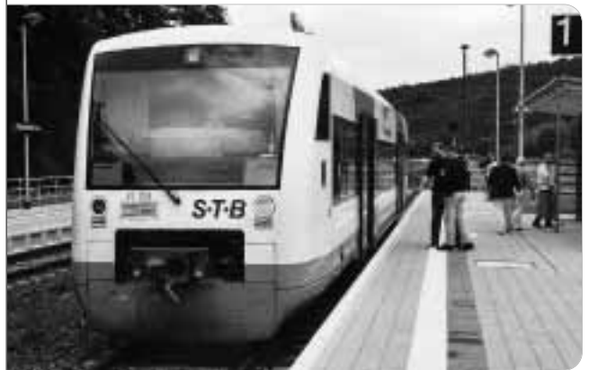
Die Erinnerung ist noch wach: 1997 legte die DB das Sonneberger Netz illegal still. Die Thüringer Eisenbahn-Gesellschaft hat daraus mit Landesmitteln ein Vorzeigeprojekt gemacht. Bahnhof Rauenstein.

Was dann folgte, war ein unseliges Hickhack zwischen dem Land Thüringen und der Deutschen Bahn AG. Das Eisenbahn-Bundesamt erließ Verfügungen zur Wiederherstellung, die von der DB nicht oder nur schleppend und teilweise befolgt wurden. Der Bund weigerte sich, seiner Pflicht zum Erhalt der Infrastruktur nachzukommen. Die DB AG