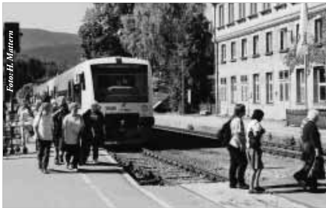
Waldbahn-Ankunft im Bahnhof Bayerisch Eisenstein.

In Plattling nimmt die Waldbahn ihren Anfang, noch im flachen Land, doch die Waldberge winken lockend am nahen Horizont.