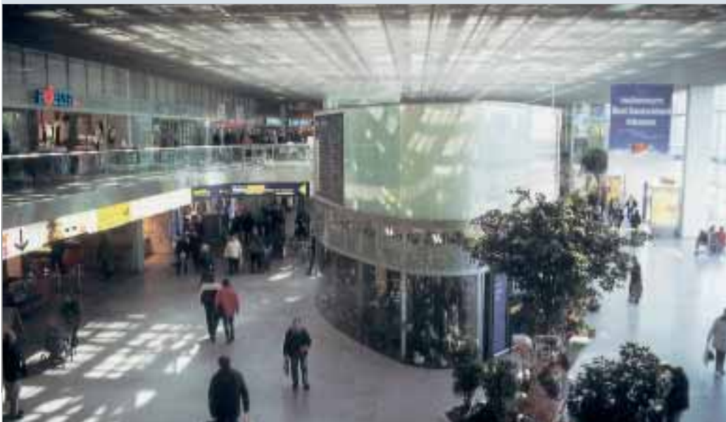
Die bis 1998 leere Bahnhofshalle ist stets von Besuchern gefüllt und auch für allerlei Veranstaltungen gut.

den Anschluss an die Betriebszentrale Berlin-Pankow von allen Stellwerken (bis auf ein Not-Stellwerk) befreit. 44 Eisenbahner gehören zu Reise & Touristik, die im Reisezentrum zu finden sind. 180 arbeiten für Station & Service und betreuen auch nachgeordnete Stationen. DB-Services ist für den Reinigungsdienst da.