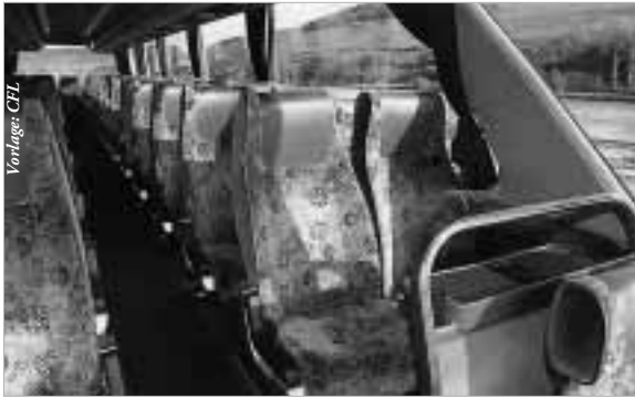
Die modernen Luxusbusse fahren 4 Mal am Tag.

Einstweilen musste man über einen 60 Kilometer langen Umweg mit Umsteigen in Metz oder Trier nach Luxemburg reisen und brauchte dafür mindestens 120 Minuten. Kein Wunder, dass unter diesen Bedingungen fast jeder mit dem Pkw fährt.