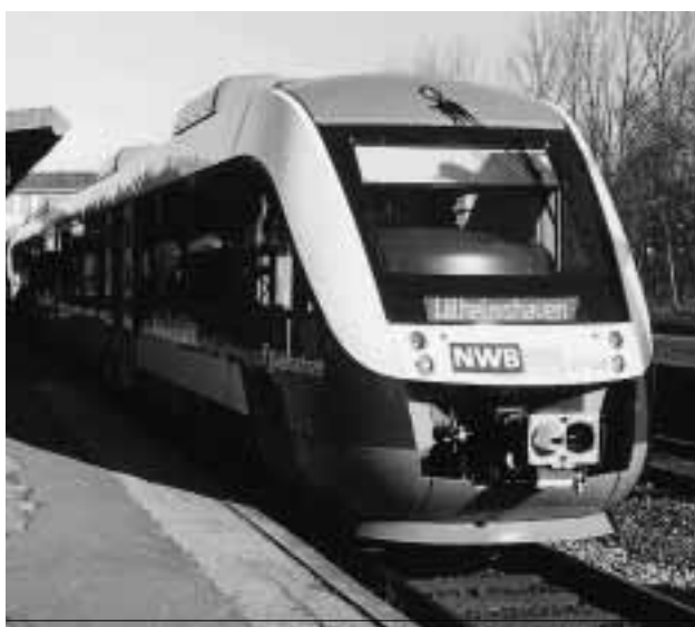
Nordwestbahn: Jetzt auch als Eilzug zwischen Bremen und Wilhelmshaven.

Die vierte Variante, ein selbstständiges Interregio-Angebot in regionaler Regie, stellt der „Flex“ dar: Ein richtiger Schnellzug mit klassischen Schnellzugwagen zwischen Hamburg und Flensburg hat die Nachfolge des Interregio angetreten und zeigt auch gleich, wie man an ein solches Konzept herangehen kann: Er fährt achtmal täglich und außerdem immer bis über die Grenze ins dänische Padborg, wo die Anschlüsse zum dänischen Netz hergestellt werden. Erst dieses Konzept ist das, was man sich unter einer schnellen Anbindung der Region vorgestellt hat: ein ganztägiges, in den integralen Takt eingebundenes Angebot. Es wird schon Ende 2003 einen Nachfolger finden: Ganz im Süden wird ein Konsortium aus Regentalbahn und der SBB-Tochter Turbo den Verkehr von München nach Oberstdorf übernehmen.