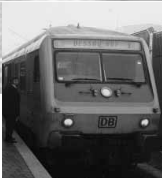
DB Regio wies den Weg: Der Regionalexpress Kassel–Halle (zeitweise bis Dessau) war einer der ersten schnellen und vertakteten Interregio-Nachfolger.