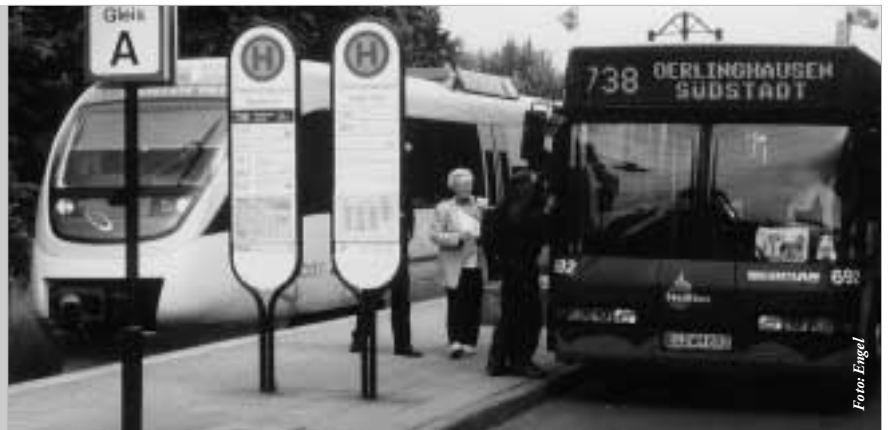
Bahn und Bus aus einem Guss: der Bahnhof Oerlinghausen.