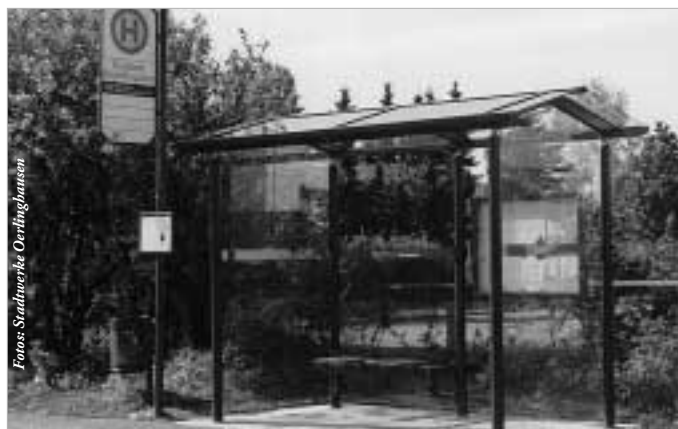
Corporate Design: die Haltestellen bekennen Farbe, sie erhalten den Blauton der Buslinie.