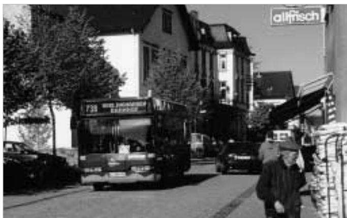
Bürgernah im wahrsten Sinne des Wortes: Stadtbus in den engen Straßen der Bergstadt.

Das erfolgreiche Oerlinghauser ÖPNV-Konzept fand auch überregionale Beachtung und Anerkennung. Der Fahrgastverband PRO BAHN hat im November 1999 den Stadtbus Oerlinghausen mit dem „Green Award“ für ein fahrgastfreundliches Stadtbussystem mit zukunftsweisender Konzeption und Vor-