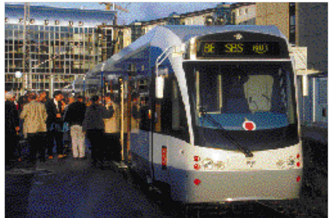
Ein neues Gesicht auf Münchens Straßen? PRO BAHN holt Saarbrücker Stadtbahn zur Demonstration. Das Publikumsinteresse ist groß.