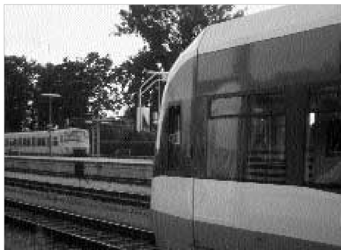
Stadtbahn trifft S-Bahn in Moosach: eine Zukunftsperspektive.

Die Idee „Stadtbahn“ ist im Raum München erst seit weniger als zehn Jahren ernsthafter Bestandteil der Diskussion um Verbesserungen des öffentlichen Nahverkehrs. Begonnen hat alles im Würmtal, einem Gebiet zwischen München-Pasing und Starnberg. Dort führte 1992 der Planungsverband Äußerer Wirtschaftsraum München eine Umweltverträglichkeitsuntersuchung für den Verkehr durch [1]. Ein darin enthaltenes Szenario mit einem stark verbesserten Angebot beim Umweltverbund (Fußwege, Radwege und öffentlicher Verkehr) und einem Rückbau von Straßen prognostizierte deutliche Verbesserungen der Lebensqualität. In der nachfolgenden Diskussion stellten sich die vorgeschlagenen Verlängerungen zweier Münchner U-Bahn-Strecken ins Umland als zu teuer heraus. PRO BAHN machte die in Karlsruhe erfolgreiche Idee der Stadtbahn zum Wegweiser für neue Lösungen.