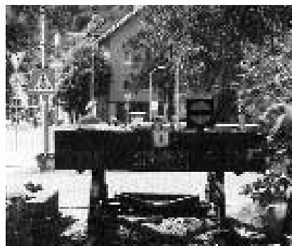
Hier endet heute die Enztalbahn ...