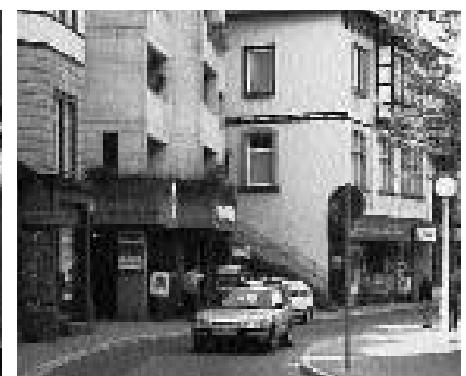
Ein sensibler Bereich: die schmale Durchfahrt in der König-Karl-Straße.