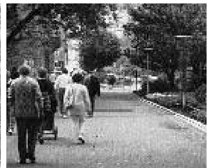
... und bis hier zum Kurpark soll sie führen.