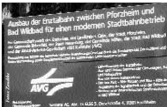
Die Bauarbeiten haben begonnen!

Falsche Zahlen und die Folgen: Schnell fand PRO BAHN heraus, dass das beauftragte Ingenieurbüro zwar exakt gerechnet hatte, aber die von anderer Seite eingebrachten Größen teilweise falsch waren. So wurden zum Beispiel für die Stadtbahnwagen zu hohe und für die Dieseltriebwagen zu niedrige Anschaffungskosten genannt. Die Elektrifizierungskosten wurden etwa doppelt so hoch berechnet, als sie in der Praxis tatsächlich sind.