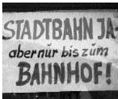
Dagegen sein ist nicht schwer – PRO BAHN leistete Aufklärungsarbeit.