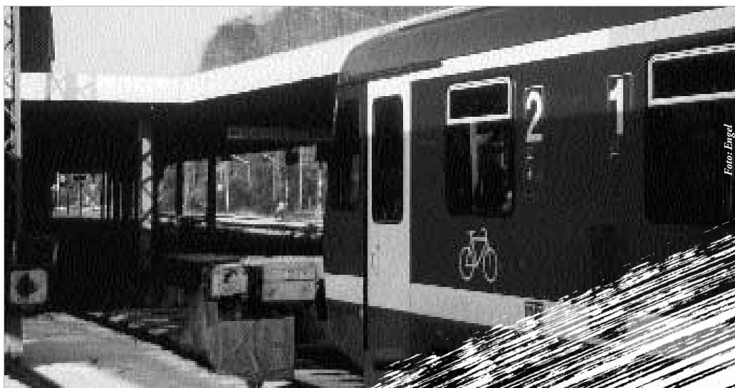
Am Prellbock in Altenbeken endet die Fahrt des „Leineweber“ aus Bielefeld. Doch nicht die Schienen verhindern die Weiterfahrt – der Interregio führt zu Denkverboten.

Der schnelle Zug heißt mittlerweile „Der Leineweber“ und startet von Bielefeld. Aber er fährt immer noch nicht nach Kassel, am Prellbock in Altenbeken ist Schluss. Nach Kassel muss man umsteigen. Bei Verspätungen muss man lange auf den nächsten Zug warten und noch ein zweites Mal umsteigen, um überhaupt in Kassel anzukommen. Dem Service-Personal in Altenbeken ist es zu verdanken, dass das nicht sehr oft der Fall ist. Mit Umsicht werden die Anschlüsse sichergestellt – solange die Zugführer der Interregio-Züge mitmachen! Aber öfters fahren sie einfach ab, während der Anschlusszug gerade einläuft. Dann müssen Taxi-Gutscheine ausgegeben werden.