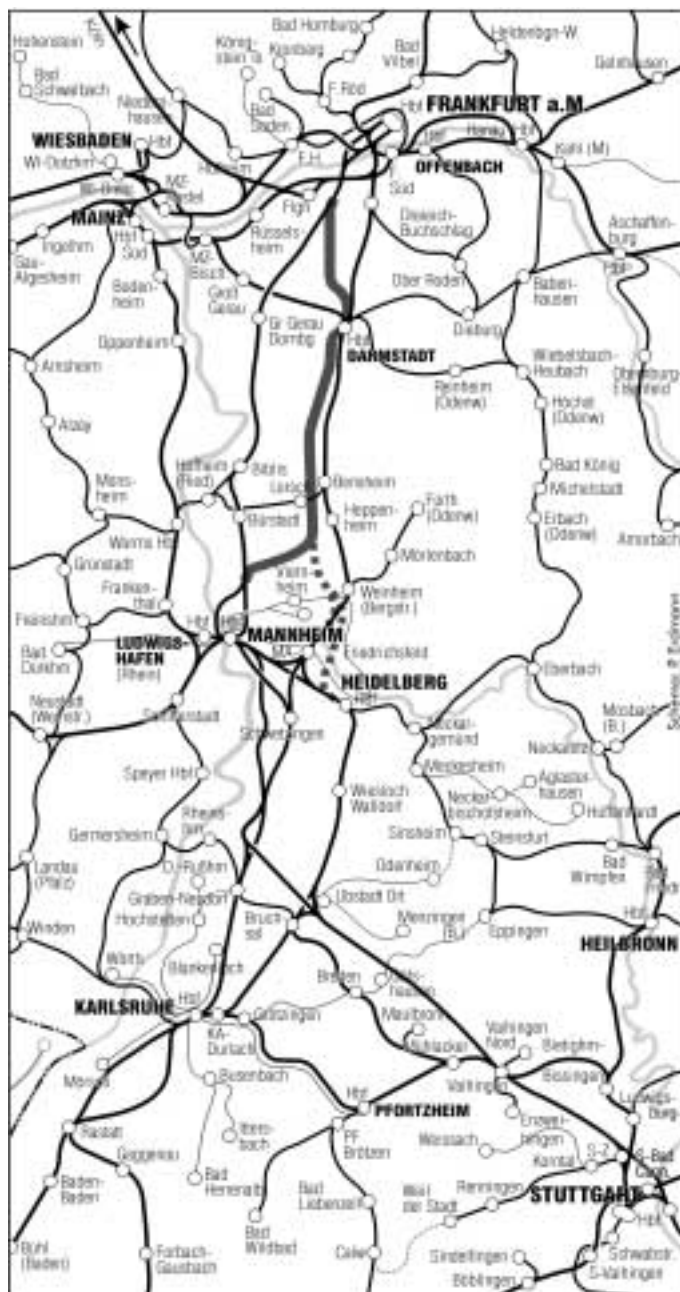
— A-5-Variante ..... PRO BAHN-Vorschlag Anbindung Heidelberg