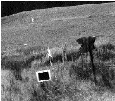
Unternehmen Zukunft? Nur gegen den Willen der DB werden wieder Züge nach Lauscha (links) und Neuhaus (rechts) fahren. Bahnhofsau-fahrt Ernstthal im November 2000.

– 5 Maßnahmen auf 4 Strecken: Gera-Greiz (2 Maßnahmen in einem Antrag) Arnstadt-Saalfeld (1 Maßnahme) Weimar-Kranichfeld (1 Maßnahme) Wernshausen-Zella-Mehlis (1 Maßnahme).