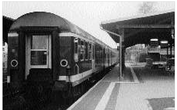
Endstation Eisfeld? Nur, weil die DB es so will?