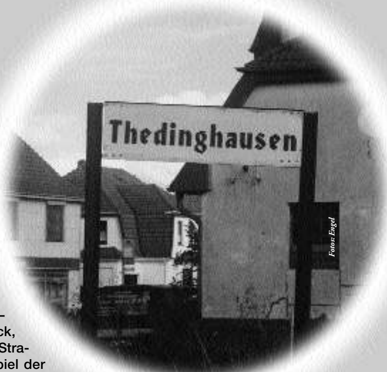
Gerettet vor der Liquidation: die Eisenbahn nach Thedinghausen.

➤ Fünf Jahre nach der „Privatisierung“ hat die öffentliche Hand die Eisenbahn nach Thedinghausen zurückgekauft. Der Investor, der die Bahn erwarb, entpuppte sich als Liquidator. Die Anliegergemeinden handelten – und kauften die Bahn zurück, gemeinsam mit der Bremer Straßenbahn AG. Ist das Beispiel der Bremisch-Hannoverschen Eisenbahn AG ein Vorbild für die Zukunft des Netzes der Deutschen Bahn AG?