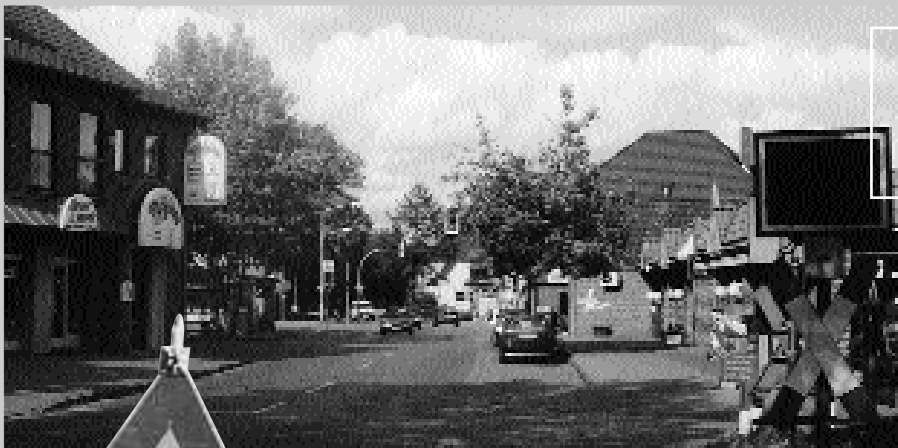
Demnächst Straßenbahn-Anschluss: Bahnhofstraße in Leeste.