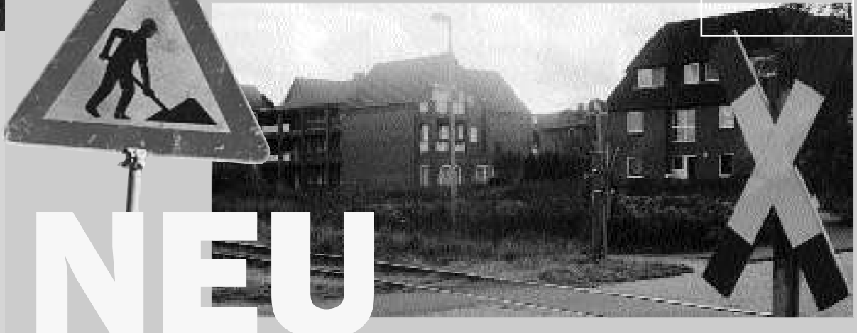
Neubauten am Haltepunkt Kirchweyhe-Ort: Hält künftig die Straßenbahn vor der Tür?