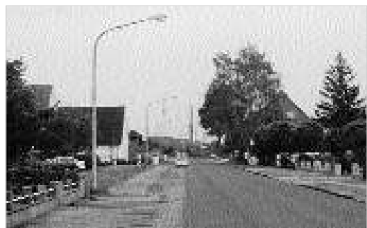
An der Bahnhofstraße gibt es noch Bauland. Die Gemeinde will sich bewusst auf den Bahnhof hin entwickeln.

Zur Zeit ist die Endabrechnung noch nicht erfolgt und daher offen, ob alle Kosten anerkannt und anteilig gefördert wer-