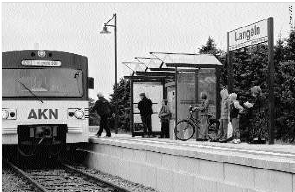
Nach 26 Jahren halten wieder Züge in Langeln. Der Hochbahnsteig hat nur 400.000 DM gekostet.

In Langeln ging der Anstoß für die Wiederinbetriebnahme von den Untersuchungen zum Nahverkehrsplan durch die Landesweite Verkehrsservicegesellschaft aus. Auf Grundlage ihrer Untersuchungen war schon vorher der Streckenabschnitt wieder in Betrieb genommen worden. Der Bahnhof war schon vor Jahren verkauft worden, so dass der Haltepunkt jetzt an anderer Stelle neu errichtet wurde. Die Kosten in Höhe von 400.000 DM wurden aus Fördermitteln und von den Aufgabenträgern getragen.