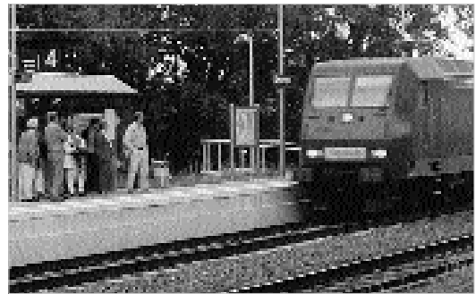
Es ist was los am Bahnhof in Dörverden. Auch nachmittags warten hier Fahrgäste auf den Zug nach Bremen.

PRO BAHN Niedersachsen wird die Gemeinde Dörverden für das Engagement für die Wiedereröffnung ihres Bahnhof mit der Verleihung des „Silbernen Schienennagels“ auszeichnen.