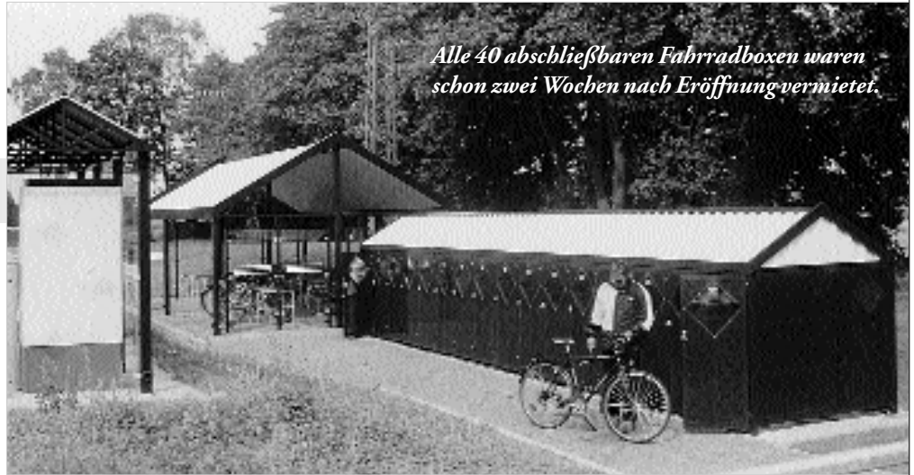
Alle 40 abschließbaren Fahrradboxen waren schon zwei Wochen nach Eröffnung vermietet.

Die große Nachfrage nach gesicherten Fahrradabstellplätzen erfordert weitere Maßnahmen: Wenn der Bedarf an Boxen abschließend erfasst ist, wird sich die Gemeinde um eine entsprechende Ergänzung der Radabstellanlagen bemühen. Zur Zeit stehen bereits 17 Anmeldungen auf einer Warteliste. Ein Teil der überdachten Fahrradständer soll zusätzlich eingezäunt werden und zwei abschließbare Gruppenboxen mit je 13 Bügeln eingerichtet werden.