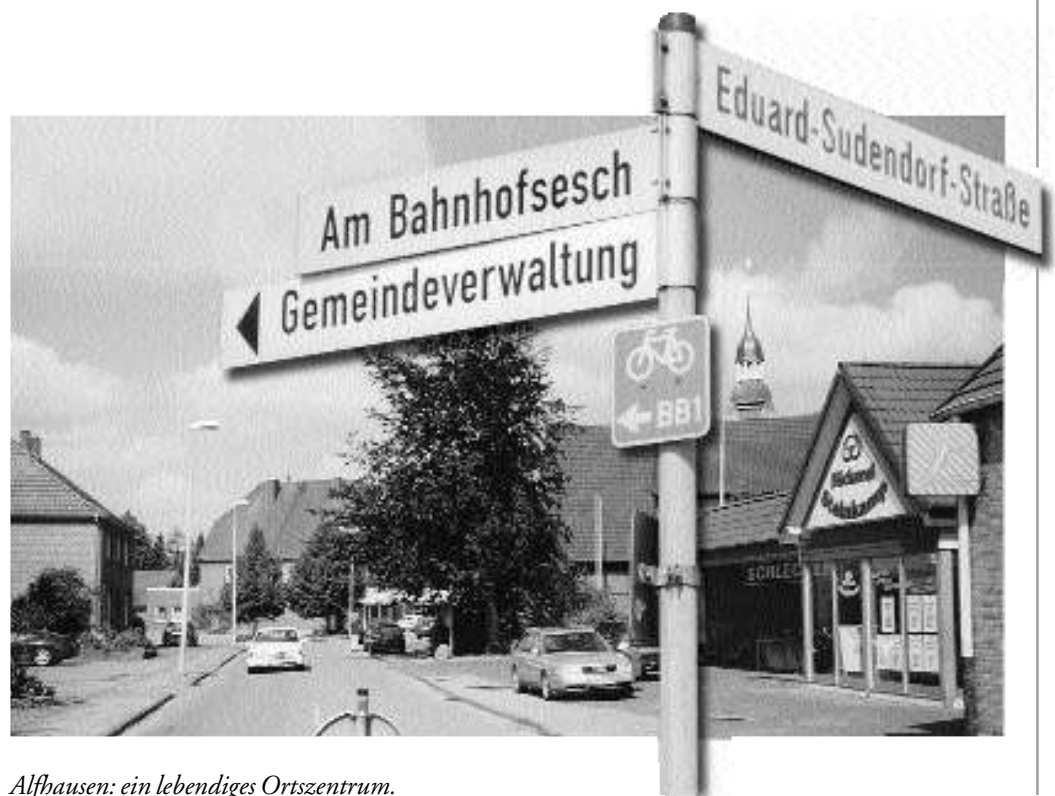
Alfhausen: ein lebendiges Ortszentrum.

Im Fall Alfhausen ist es besonders einfach: Die fehlenden Minuten werden im benachbarten Bahnhof Bersenbrück verplempert. Veraltete Signaltechnik und ein mangelhaft gesicherter Zugang zum Bahnsteig erfordern Haltezeiten, die den Möglichkeiten der modernen Triebwagen Hohn spotten.