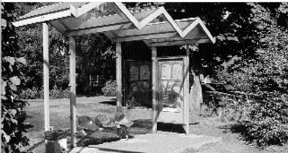
Eine neue Warthalle am Bahnsteig. Wird sie jetzt leer bleiben, weil DB-Netz das so will?

Daher hat die Nordwestbahn schon im Mai auf das Problem hingewiesen, dass im Bahnhof Bersenbrück Veränderun-