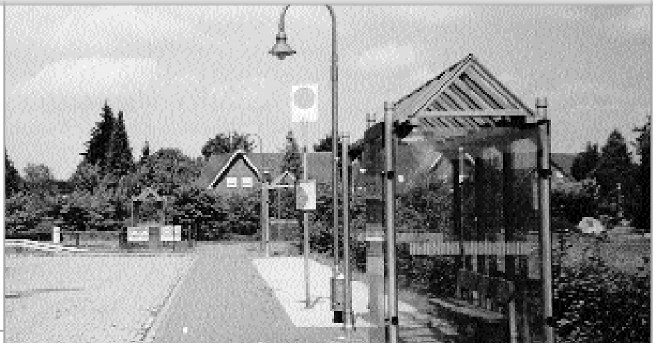
Typisch Niedersachsen: Gute Bushaltestellen – aber keine Busse! Hier in Alfhausen hält morgens und mittags je dreimal ein Schulbus – an nur 200 Tagen im Jahr.

Nachdem klar wurde, dass die Fahrgäste aus Alfhausen sich nicht so einfach vertreiben lassen, hat man in Hannover gehandelt. Eine Million Mark aus Landesmitteln stehen mittlerweile zur Verfügung, damit auch im Bahnhof Bersenbrück moderne Verhältnisse geschaffen werden können. Doch damit etwas geschieht, braucht man einen Vertrag mit der DB.