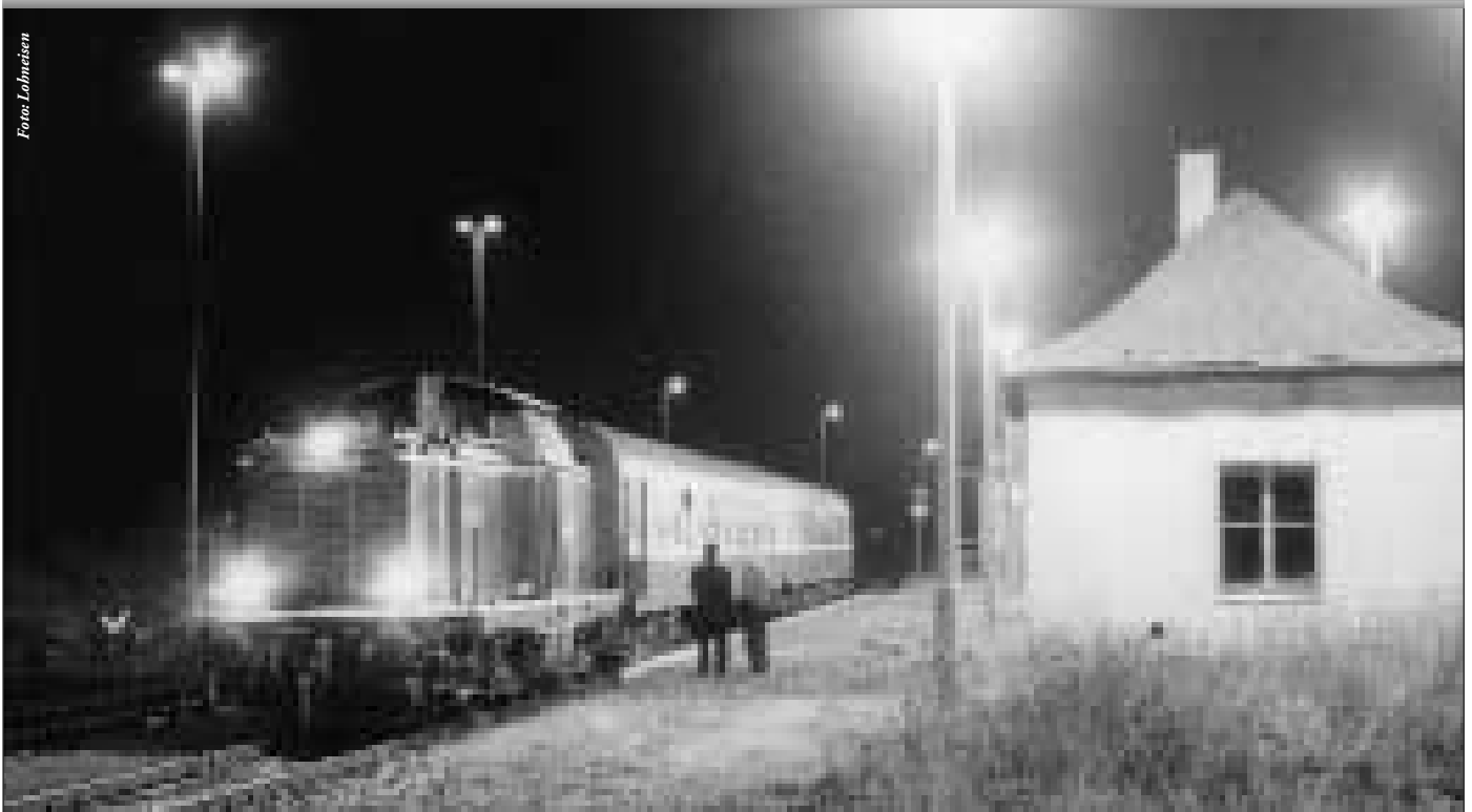
Züge nach Dunkelwerden: eine aussterbende Spezies?